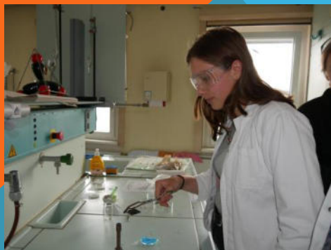
Tag der offenen Tür 2020